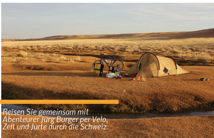
Reisen Sie gemeinsam mit Abenteuer Jürg Burger per Velo, Zelt und Jurte durch die Schweiz.